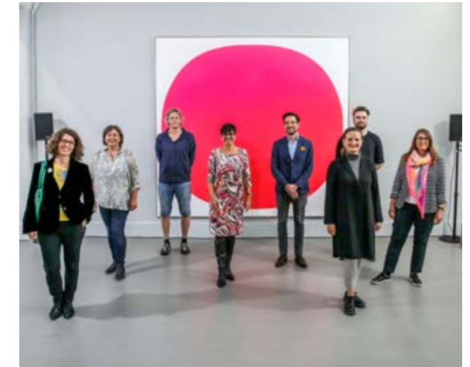
Gemeinsam stark – das erweiterte Präsidium des BLVKK auf dem 1. Verbandstag in Ingolstadt.

Erst durch den Dachverband können die bayerischen Akteurs-Netzwerke die nötige personelle und flächen-deckende Kraft entwickeln, die wir für eine starke Verhandlungsposition gegenüber der Landesregierung dringend brauchen!